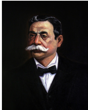
Dr. Federico Villarreal

En 1877 viaja a Lima e ingresa a la Facultad de Ciencias de la Universidad Nacional Mayor de San Marcos, destacando por su dedicación al estudio. Optó su grado de bachiller en el año de 1879 con la tesis Fórmulas y métodos que deben complementarse en matemática pura y en 1880, la licenciatura, con su tesis El efecto de refracción sobre el disco de los astros .