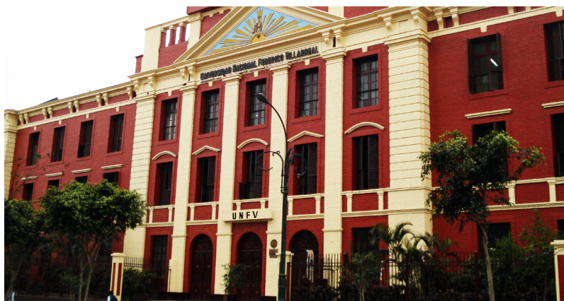
Frontis del Local Central de la UNFV

El 18 de octubre de 1963 el Congreso de la República, presidido por el senador Julio de la Piedra, aprobó la ley 14692 que reconoce como Universidad Nacional Federico Villarreal a la ex filial de Lima, promulgada por el gobierno central el 30 de octubre del mismo año.